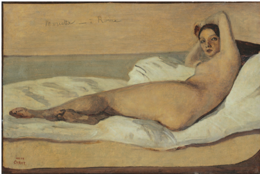
Jean-Baptiste Camille Corot Marietta (à Rome) , 1843 Öl auf Papier auf Leinwand, 29,3 × 44,2 cm Musée du Petit Palais, Paris