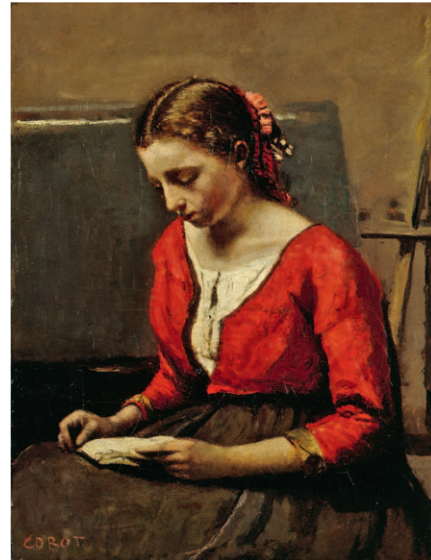
Jean-Baptiste Camille Corot Jeune femme blonde assise, les yeux baissés et lisant ( Sitzende junge blonde Frau mit gesenktem Blick beim Lesen ), um 1845/50 Öl auf Leinwand, 42,5×32,5 cm Stiftung Sammlung E. G. Bührle, Zürich