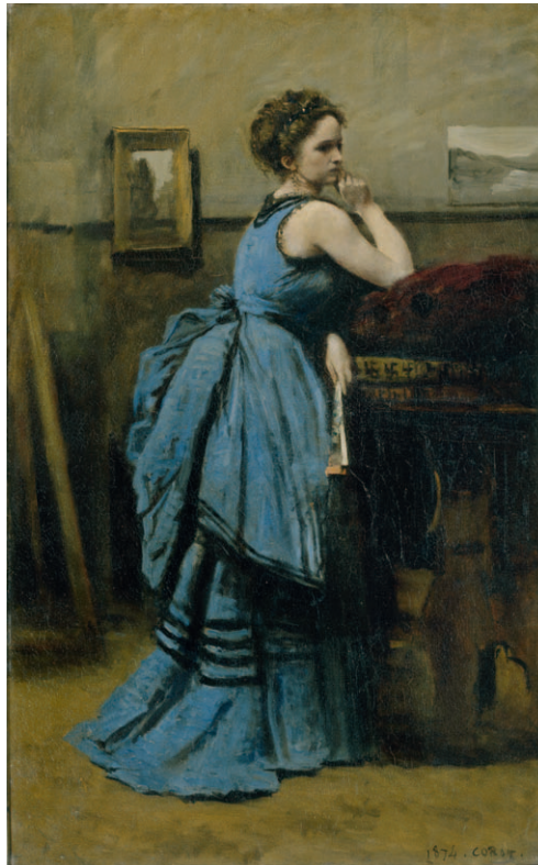
Jean-Baptiste Camille Corot La Dame bleue (Blaue Dame) , 1874 Öl auf Leinwand, 80×50,5 cm Musée du Louvre, Paris