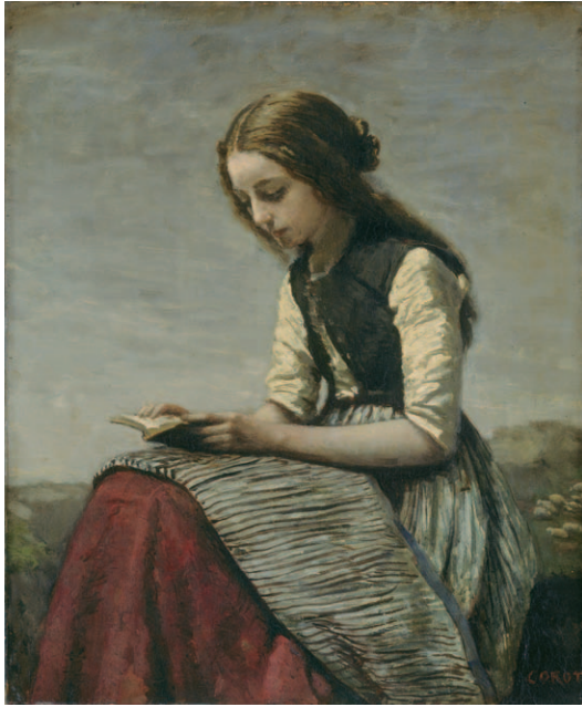
Jean-Baptiste Camille Corot La Petite Liseuse oder Jeune bergère assise et lisant ( Lesendes Mädchen oder Sitzendes Hirtenmädchen beim Lesen ), um 1855/61 Öl auf Leinwand, 46,5×38,5 cm Sammlung Oskar Reinhart «Am Römerholz», Winterthur