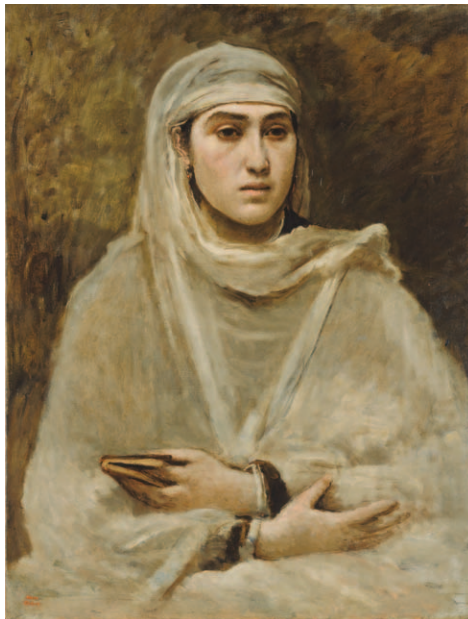
Jean-Baptiste Camille Corot L'Algérienne oder Algérienne drapée de blanc ( Algerierin oder Weiss verhüllte Algerierin ), 1870/73 Öl auf Leinwand, 79 × 60 cm Arp Museum Bahnhof Rolandseck, Stiftung Sammlung Gustav Rau, Remagen