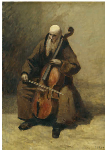
Jean-Baptiste Camille Corot Le Moine au violoncelle (Mönch mit Violoncello) , 1874 Öl auf Leinwand, 72,5×51 cm Hamburger Kunsthalle