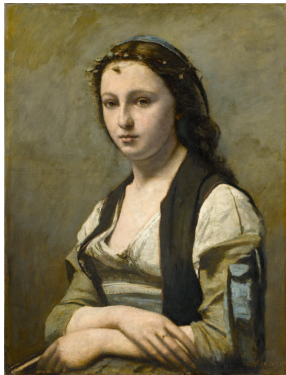
Jean-Baptiste Camille Corot La Femme à la perle ( Frau mit Perle ), um 1858–1868 Öl auf Leinwand, 70×55 cm Musée du Louvre, Paris