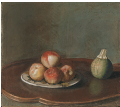
Jean-Etienne Liotard (1702-1789) Nature morte aux pêches et à la courge, 1783 Pastel sur papier marouflé sur toile, 32 x 35,5 cm Musée Oskar Reinhart am Stadtgarten, Winterthur