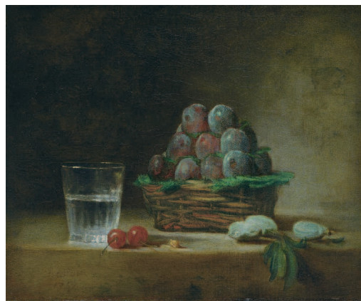
Jean-Siméon Chardin (1699-1779) Panier de prunes et verre d'eau, 1759 Huile sur toile, 37 x 45,5 cm Collection Oskar Reinhart « Am Römerholz », Winterthur