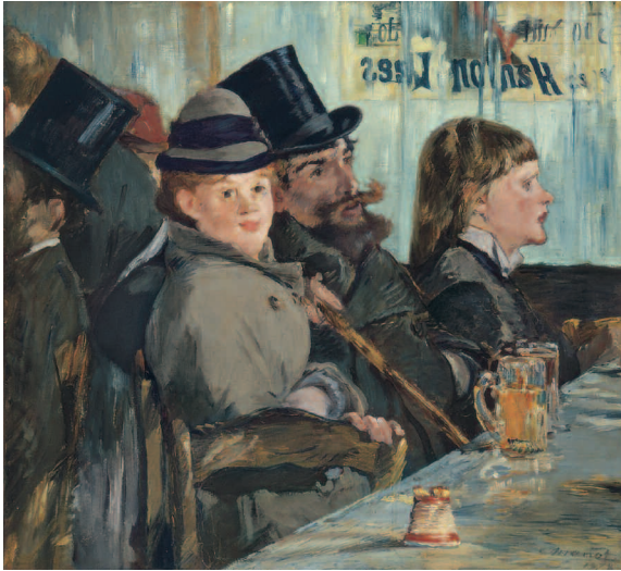
Edouard Manet (1832-1883) Au café , 1878 Huile sur toile, 78 x 84 cm Collection Oskar Reinhart « Am Römerholz », Winterthur