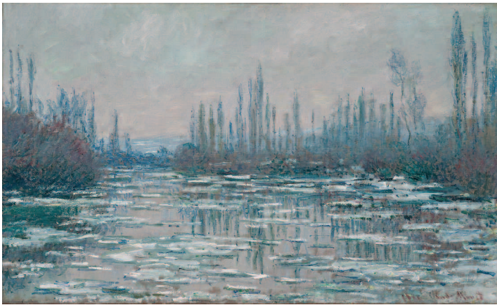
Claude Monet (1840-1926) La Débâcle , 1880-1881 Huile sur toile, 60 x 99 cm Collection Oskar Reinhart « Am Römerholz », Winterthur