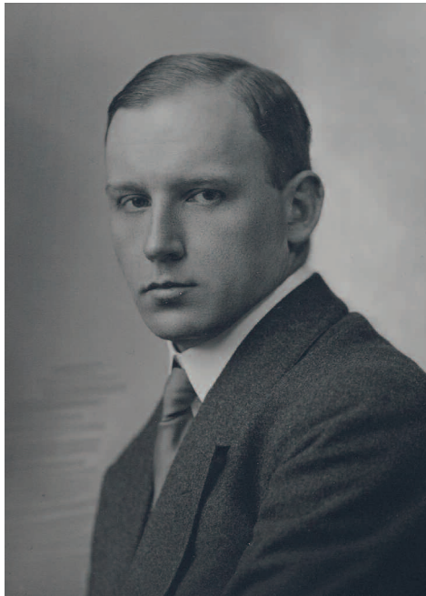
Le jeune Oskar Reinhart (1885-1965)