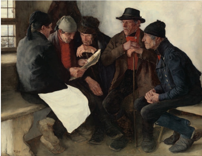
Wilhelm Leibl (1844-1900) Politiciens de village , 1877 Huile sur bois, 76 x 97 cm Musée Oskar Reinhart am Stadtgarten, Winterthur