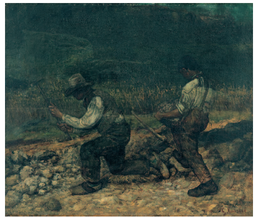
Gustave Courbet (1819-1877) Les Casseurs de pierres , vers 1849 Huile sur toile, 56 x 65 cm Collection Oskar Reinhart « Am Römerholz », Winterthur