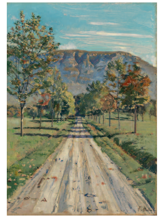
Ferdinand Hodler (1853-1918) La route d'Evordes , vers 1890 Huile sur toile, 62,5 x 44,4 cm Musée Oskar Reinhart am Stadtgarten, Winterthur