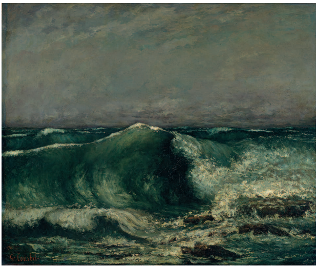
Gustave Courbet (1819-1877) La Vague , 1870 Huile sur toile, 80,5 x 99,5 cm Collection Oskar Reinhart « Am Römerholz », Winterthur